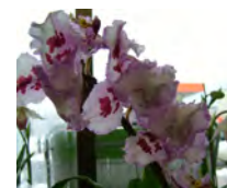
オドントグロッサム

ほっかいどう世界の蘭展2004 5月1日(土)~6日(木) 25,000点 アクセスサッポロ 9:30~17:00 入場料当日1,500円