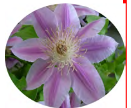
クレマチス ドクターラッペル

クレマチスという名前ピンとこないかもしれませんが、“てっせん”という名前はご存知の方も多いいのではないでしょうか。“てっせん”はクレマチス属の一品種(原種)で、本来は別物なのです。クレマチスの花色は紫、青、白、赤などの単色の物から、混色など豊富で最近では四季咲き性の強いものが増えてきています。