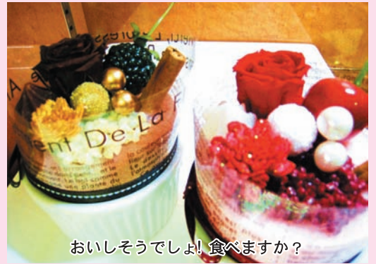
おいしそうでしょ! 食べますか?