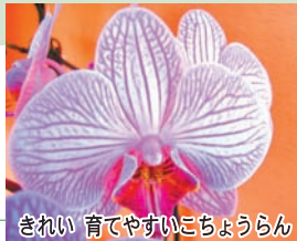
きれい 育てやすいこちょうらん

色々な洋ランを見ると、咲き方や、特徴がわかってきます。花だけでなく、葉や茎を見ることも大切です。