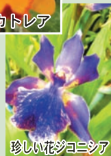
珍しい花シヨコシア

温度や水やりは、それぞれのお花で異なってきます。わからないことは、店員に聞いてみましょう。